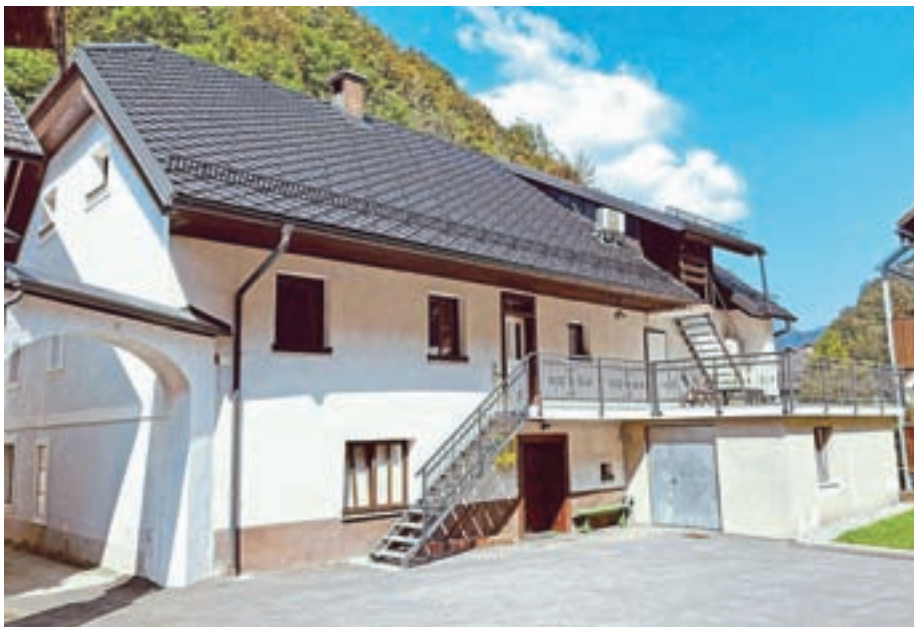
Lovski dom Na plavžu

Lovišče LD Železniki je eno največjih v Sloveniji in največje na Gorenjskem. Obsega 9159 hektarjev, od tega je 8965 hektarjev lovnih površin. Največji sklenjeni nelovni površini sta območje mesta Železniki in mokrišče Ledina na Jelovici. Lovišče leži v osrednjem delu Selške doline, med Železniki in Področtom. Zajema celotne katastrske občine Podlonk, Železniki, Martinj Vrh, Zali Log ter dele katastrskih občin Dražgoše, Studeno, Davča, Danje, Gorenja Ravan, Leskoviča, Nemški Rovt, Nomenj in Selo. Več kot 80 odstotkov lovišča obsegajo gozdne površine, od tega je okoli polovica gozdov s prevladujočimi iglavci, tretjina pa s prevladujočimi listavci. Drugo so mešani gozdovi in grmišča. Kmetijske površine, zlasti pašniki, travniki in v manjši meri njive, zajemajo približno 15 odstotkov površine lovišča. Drugo so nelovne površine. Reliefno lovišče leži med 440 in 1678 metri nadmorske višine. Svet do