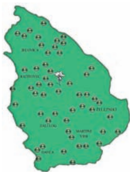
Lovišče Lovske družine Železniki

Do takrat pa lovski pozdrav, vsem lovcem pa: "Dober pogled!"