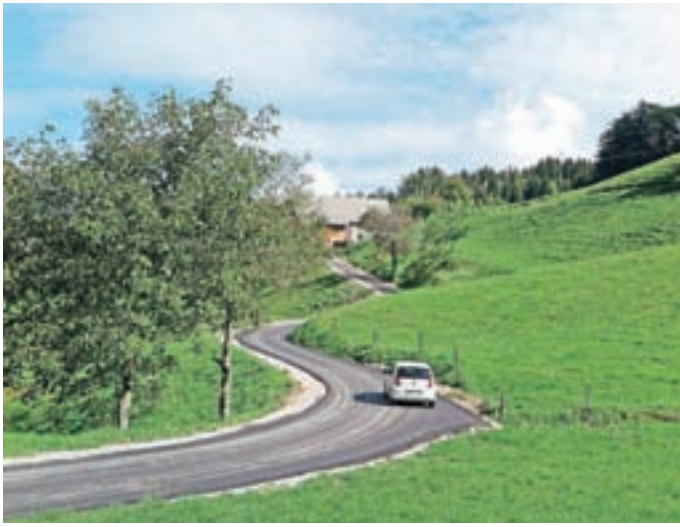
V Martinj Vrhu so asfaltirali dobrega pol kilometra ceste do Bohinca.