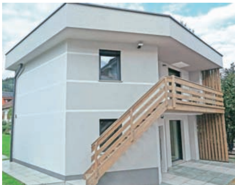
Aljošev novi dom