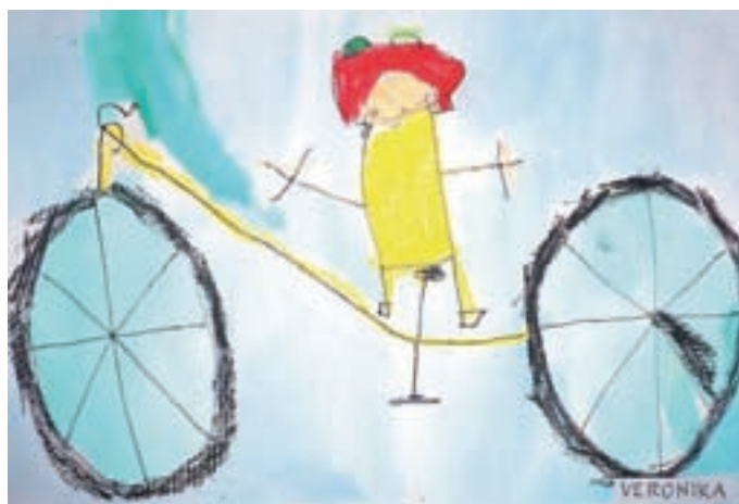
Tadej Pogačar v rumeni majici

Letošnjo jesen smo tudi sicer začeli zelo gibalno obarvano. Otroci starejše skupine so opravili že kar nekaj daljših izletov. Odšli so do nogometnega igrišča v Njivici, bili so v Dašnici, pri oddajniku nad vrtcem in na gozdni učni poti na Kresu. Tudi otroci iz mlajše in srednje skupine hodijo na izlete, vendar so ti krajši, saj so nekateri otroci komaj shodili. V nadaljevanju leta bomo pridno telovadili in se gibalno, saj smo vključeni tudi v športno-gibalni program Mali sonček, projekt Skrbimo za naše zdravje ter Tek podnebne solidarnosti.