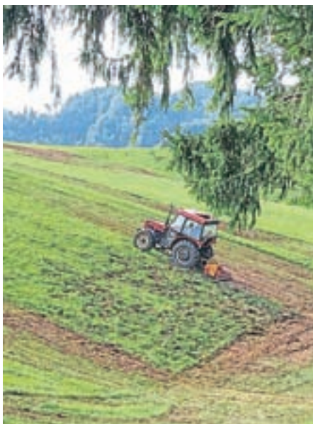
Delovna akcija s traktorjem