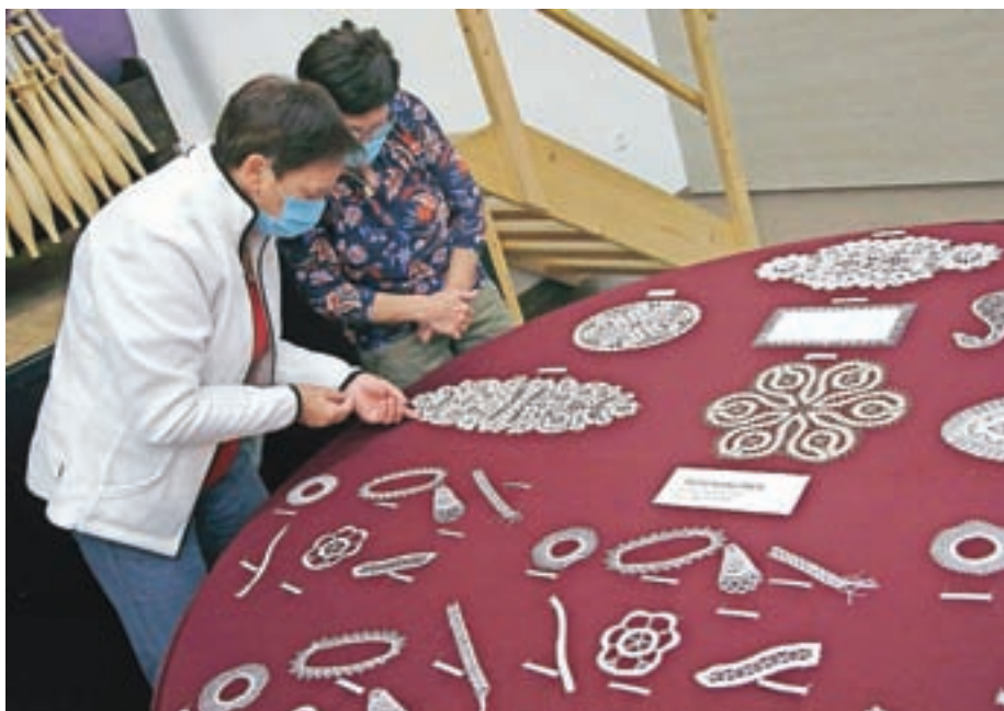
Na ogled so bili izdelki domačih klekljaric ter učenk in učencev iz čipkarske šole.

Kljub razmeram, povezanim s koronavirusom, je Turistično društvo (TD) Železniki tretji septembrski konec tedna spravilo pod streho 58. Čipkarske dneve, s čimer je ohranilo kontinuiteto festivala, ki ga neprekinjeno prirejajo že vse od leta 1963. Prireditve, ki so jo sicer načrtovali že konec junija, je bila tokrat vsebinsko precej manj bogata kot prejšnje. Postregla je z razstavami v kulturnem domu, ki so naletele na lep odziv, organizatorji pa so opažali tudi obiskovalce iz drugih krajev. "Z obiskom smo bili zadovoljni, to pomeni, da je čipka kljub omejitvam še vedno visoko cenjena. Z vseh strani smo tudi letos prejeli če-