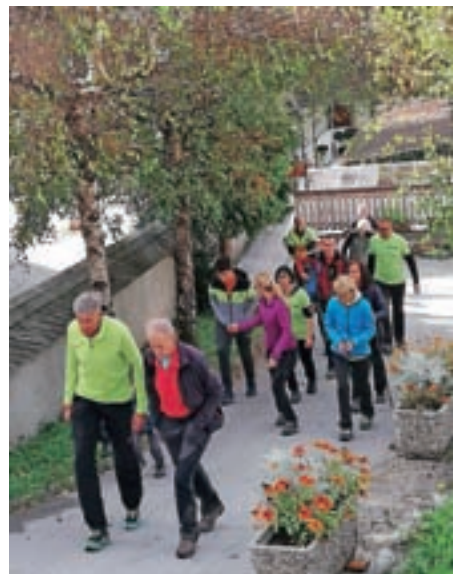
Z etnografsko-kulinaričnega pohoda v Sušo

Dopoldne so pripravili voden pohod v Sušo. "Pohodniki so izvedeli marsikatero zanimivost o Zalem Logu, Suši, Strojcevem skrilolomu ... Predstavili smo tudi novost na poti v Sušo – maketo Ža-