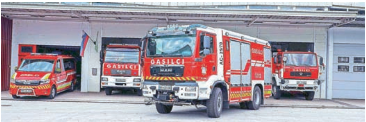
Vozni park PGD Železniki na čelu z novo pridobitvijo – avtocisterno AC-25/70 z maksimalnim pretokom vode 2500 litrov na minuto in kapaciteto rezervoarja za sedem tisoč litrov vode. Investicija v novo vozilo je vredna med 270 in 280 tisoč evri.

Ob tem je opozoril še, da je za splošno varnost občanov nujno vzgajati mladino. "Starše bi radi spodbudili, da svoje otroke vključijo v našo sredino, saj z otroki odlično delamo. Prav zaradi varnosti otrok smo investirali v nakup novega kombija, saj po vajah vse otroke sami odpeljemo domov. Tako staršem prihranimo del njihovega dragocenega časa."