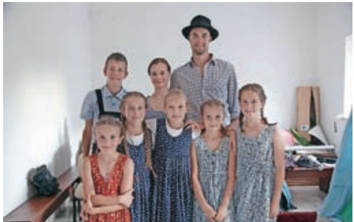
Turistični podmladek, ki je zaigral kratko igro o življenju na soriškem območju po tirolski naselitvi