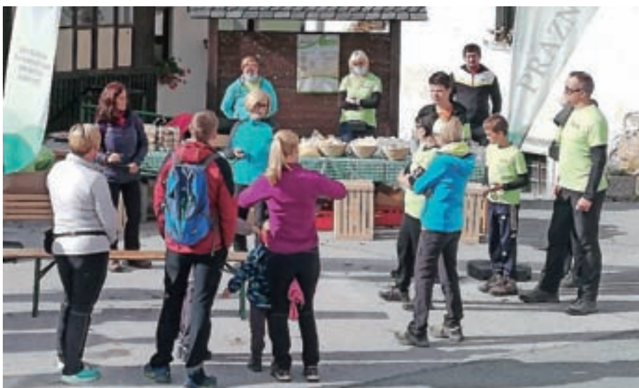
Potekala je tudi tržnica domačih pridelkov in izdelkov.

garjevega hleva. Pohodnike smo pogostili z zeljno potico in zeljnim burekom, avtohtono žganjico zeloucem in zdravilno vodo iz Suše," je pojasnila. Po pohodu so se v gostilni Pri Slavcu okrepčali s segedinom. Popoldne so sledile še stare vaške zeljne igre in delavnica za otroke. Potekala je tudi tržnica domačih pridelkov in izdelkov, ki je bila lepo obiskana. "Obiskovalci so kupovali predvsem zelje in druge domače dobrote, dobro se je prodajala tudi zeljna potica," je dejala.