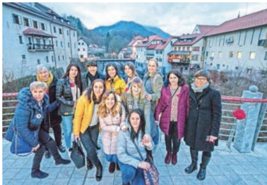
Kvačkarska intervencija na mostu v Škofji Loki ob letošnjem dnevu žena

S projektom Prepletanja prihajamo tudi v Železnike. Potencialne udeleženke dosegamo v sodelovanju z vrtcem in šolo, nagovarjamo pa tudi podjetja, da povabilo širijo med svoje zaposlene. Srečamo se vsak četrtek ob 10. uri v knjižnici na Češnjici, tečaj pa traja dve šolski uri. Prijave sprejemamo na nina@zavod-tri.org ali 040 528 387.