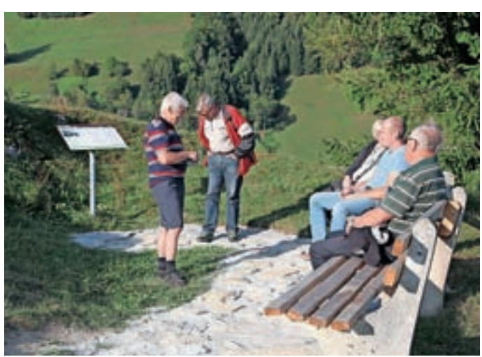
Namesto ene so pri Groharjevem spomeniku sedaj na voljo tri klopi.