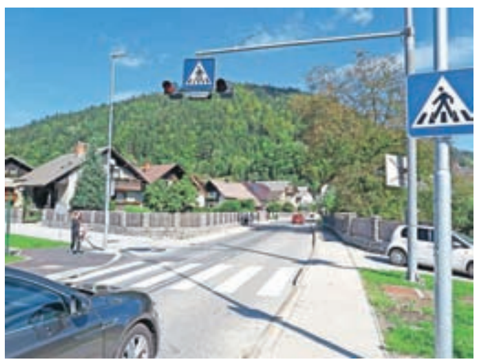
Na regionalni cesti pri šoli v Selcih so uredili prehod za pešce.