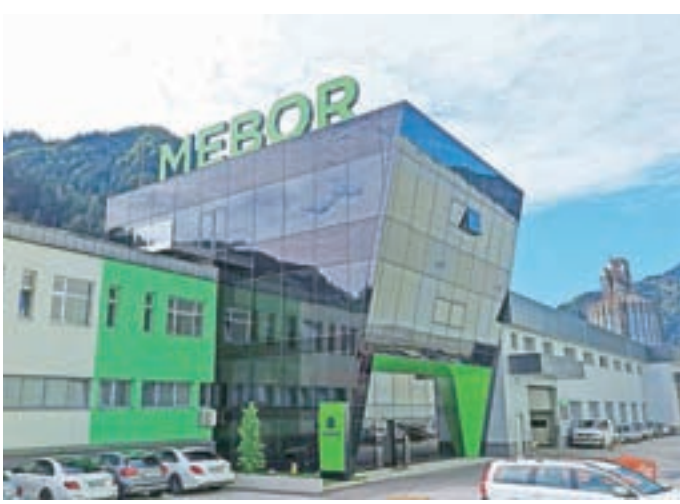
Podjetje je letos investiralo v razširitev upravne stavbe.